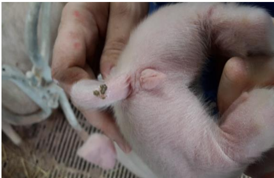
Grisen har ikke diarré